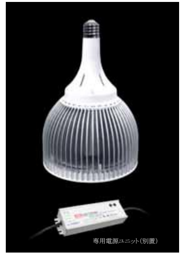
専用電源ユニット(別置)

本LEDランプを既存の水銀灯器具で使用する場合、冷却をよくするために、シェード(笠)を、取り外してご使用下さい。また既存の安定器を取り外し、専用電源ユニットを使用して下さい。